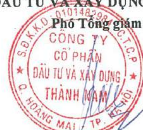
Đinh Thị Minh Hằng

(Các thuyết minh từ trang 10 đến trang 38 là bộ phận hợp thành của Báo cáo tài chính này)