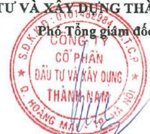
Đinh/Thị Minh Hằng

(Các thuyết minh từ trang 10 đến trang 38 là bộ phận hợp thành của Báo cáo tài chính này)