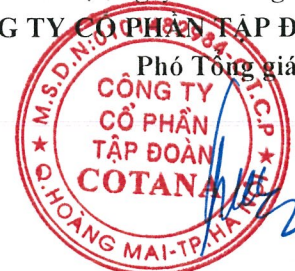
Trần Trọng Đại