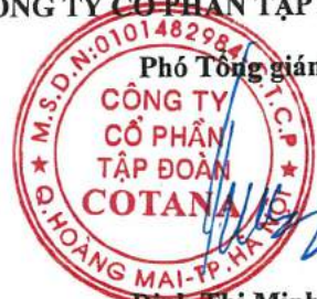
Trần Trọng Đại